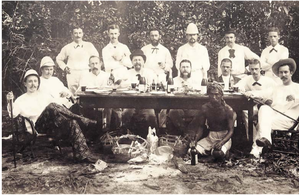
Zu Füssen der Herren: «Schweizer-Ausflug nach der Insel Edam» – nördlich des heutigen Jakarta.

Schlicht «Museum» steht in Goldbuchstaben über dem Hauseingang mitten im Appenzeller Dorf Heiden. Das kleine Museum, das in den oberen Stockwerken des Hauses eingerichtet ist, wurde 1859 gegründet und beherbergt eine vielgestaltige Exponatensammlung. Nebst ausgestopften einheimischen Tieren und historischen Einrichtungs- und Haushaltgegenständen aus der Gegend zeigt das Museum diverse Artefakte aus dem heutigen Indonesien: Waffen, Hüte, Stoffe, eine ausgestopfte Python, die gemäss Infotafel 1896 lebendig in Heiden ankam, ihren ersten Winter dort aber nicht überlebte. Appenzeller Handelsreisende, die in Südostasien auf den Spuren niederländischer Kolonialherren Geschäfte machten, hatten die Objekte in die Heimat zurückgebracht.